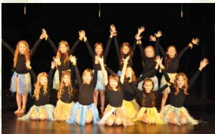
Vianočné predstavenie Cesta okolo sveta za 80.dní, 2010

2005/2006 Putovanie za hviezdou 2006/2007 Malý princ, Škaredé káčatko 2007/2008 Dorotkine Vianoce 2008/2009 Kde bolo, tam bolo 2009/2010 5.výročie založenia ZUŠ 2010/2011 Cesta okolo sveta za 80. dní 2011/2012 Legenda o škriatkoch 2012/2013 Luskáčik 2013/2014 Dievčatko so zápalkami