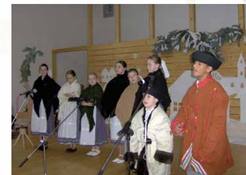
Vianočné predstavenie Putovanie za hviezdou, 2005