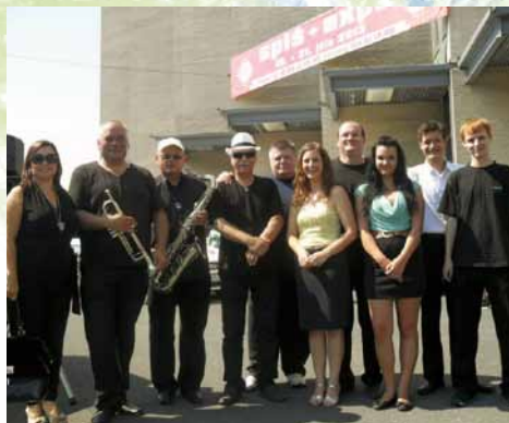
Tanečný orchester ART SCHOOL BAND