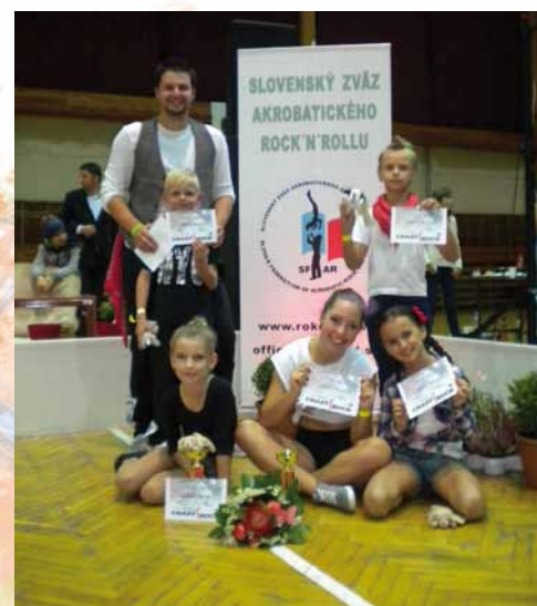
Medzinárodné majstrovstvá Slovenska v akrobatickom rock and rolle - Detva 2013