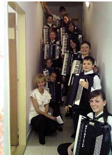
Akordeónový súbor „Sneženky“