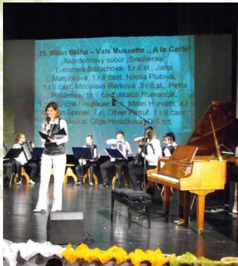
Novoročný koncert 2013