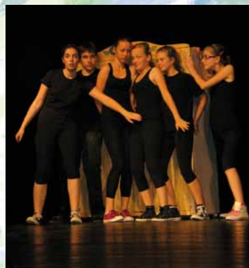
Divadelný súbor „LEN TAK“ J. Werich - O lakomej Barbore –