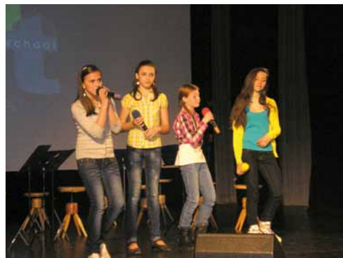
Mladí hudobníci 2012