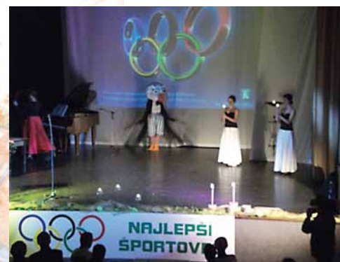
Slávnostný ceremoniál - Oceňovanie športovec roka 2012

Smižany - režijné, organizačno–technické zabezpečenie podujatia, úvodný a záverečný ceremoniál a kultúrny program,