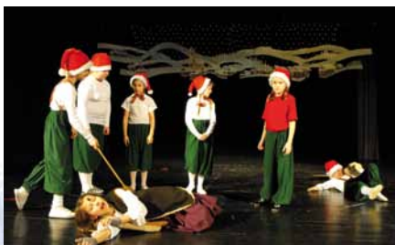
Vianočné predstavenie Dievčatko so zápalkami, 2013