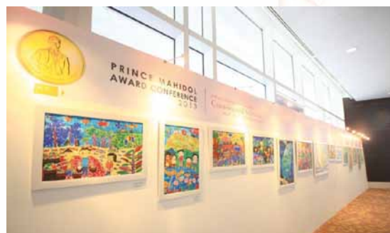
Medzinárodná súťaž - Onehealth world artcontest 2013 Princ Mahidol art contest, Thajsko