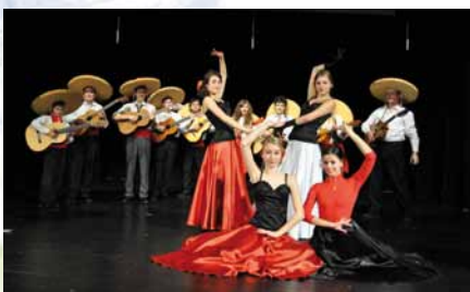
5. výročie založenia ZUŠ, 2009