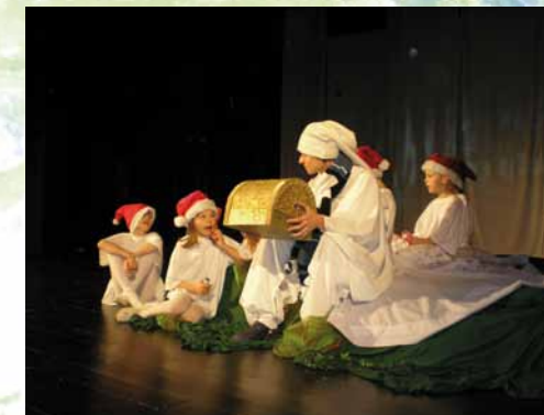
Vianočné predstavenie Legenda o škriatkoch, 2011