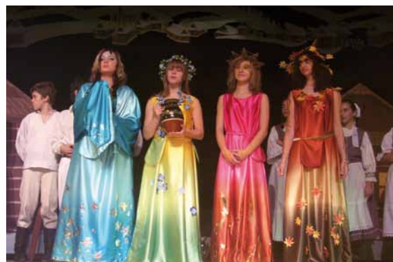
Vianočné predstavenie- Kde bolo, tam bolo, 2008