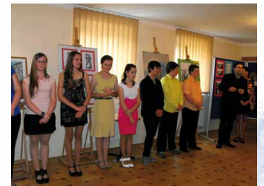
Absolventská vernisáž 2013