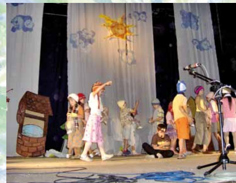
Vianočné predstavenie - Škaredé káčatko, 2006