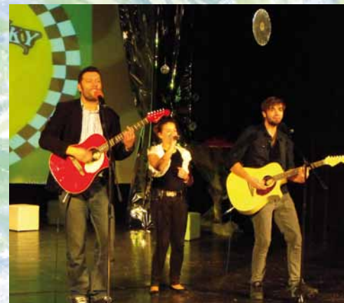
Karaoke show 2013