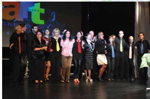
5. výročie založenia ZUŠ, 2009