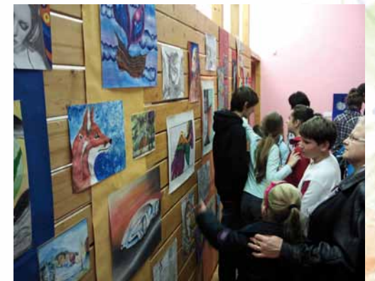
Jesenná výstava prác žiakov výtvarného odboru