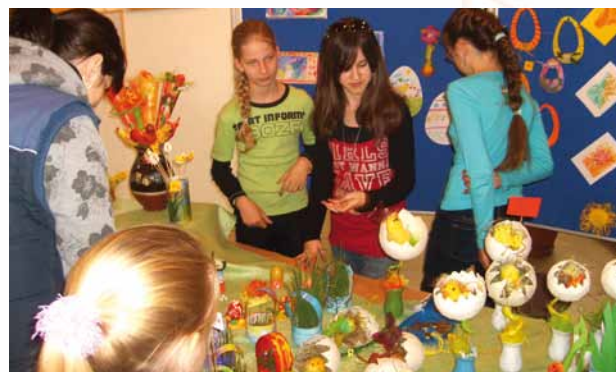
Čaro jari - výtvarná burza dekoračných prác žiakov