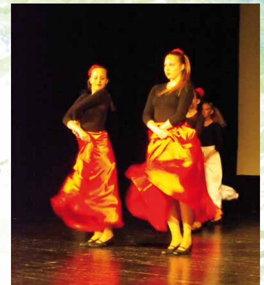
Absolventské predstavenie tanečného odboru 2013