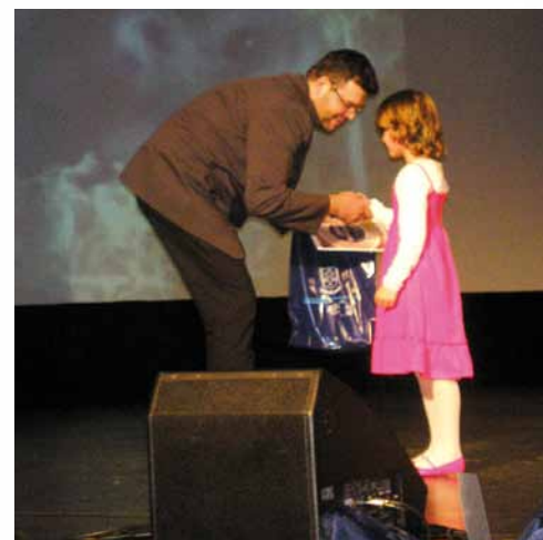
Školská fotosúťaž žiakov výtvarného odboru „Umelecká a počítačom manipulovaná fotografia“