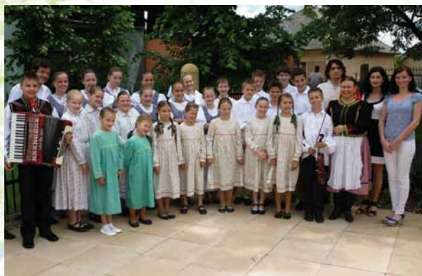
DFS Orišek na Smižianskych folklórnych slávnostiach