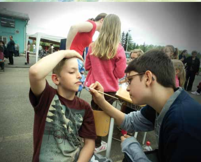
Vitaj leto – maľovanie na tvár 2013