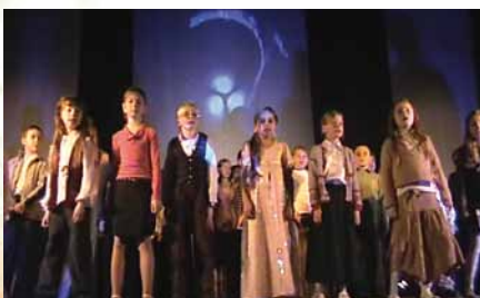
Vianočné predstavenie - Malý princ, 2006