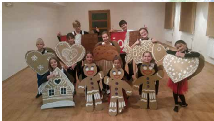
Rock and rollový súbor Rockino