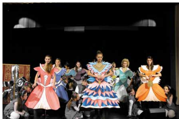
Vianočné predstavenie –Luskáčik, 2012