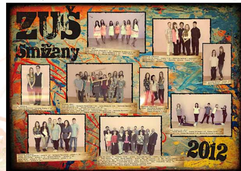
Absolventské tablo 2012