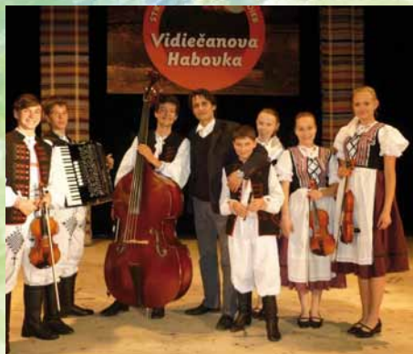
DLH Orišek na celoštátnom festivale v Habovke