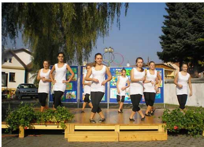
Beh ulicami Smižian a tanečnice z Pasdechat

„Tí ktorí vychovávajú deti, by mali byť viac ctení ako tí, ktorí ich splodili,