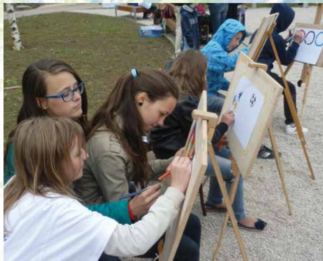
Olympijský festival detí a mládeže Slovenska – žiaci maľujú na výtvarnú súťaž Londýn 2012 – olympijské mesto.

Oceňovanie športovec roka – oceňovanie najúspešnejších športovcov za okres Spišská Nová Ves, Gelnica, Levoča, Krompachy – úvodný a záverečný ceremoniál a kultúrny program v koncertnej sále Reduty v Spišskej Novej Vsi,