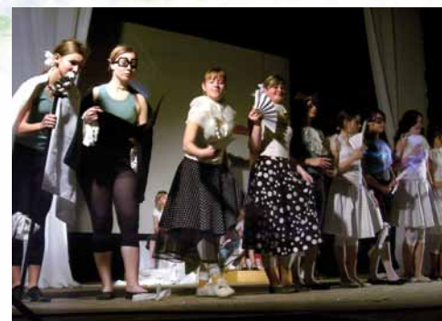
Vianočné predstavenie- Dorotkine Vianoce, 2007