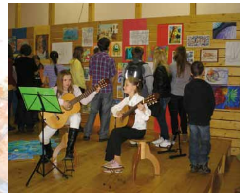
Slávnostná vernisáž žiakov výtvarného odboru 2012