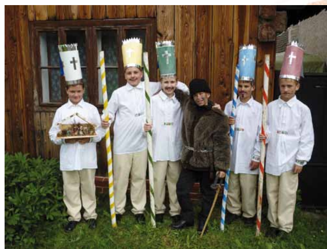
DFS Orišek – Jasličkari, celoslovenská súťaž detského hudobného folklóru – Likavka 2013