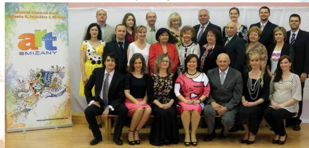
Zamestnanci 2013-2014- Na snímke zľava