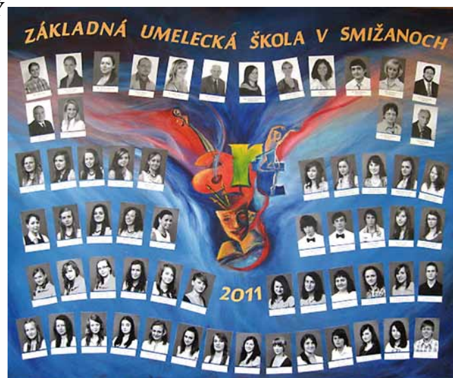
Absolventské tablo 2011