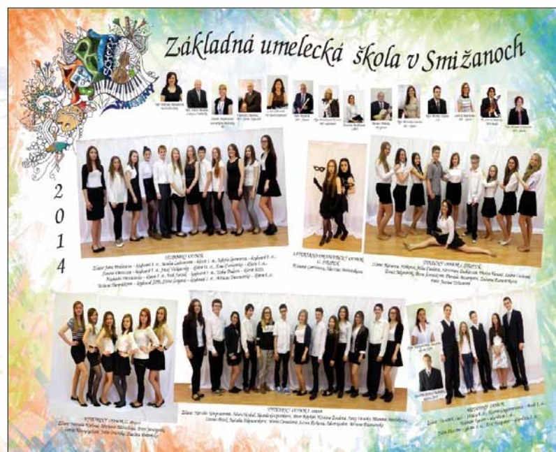
Absolventské tablo 2014