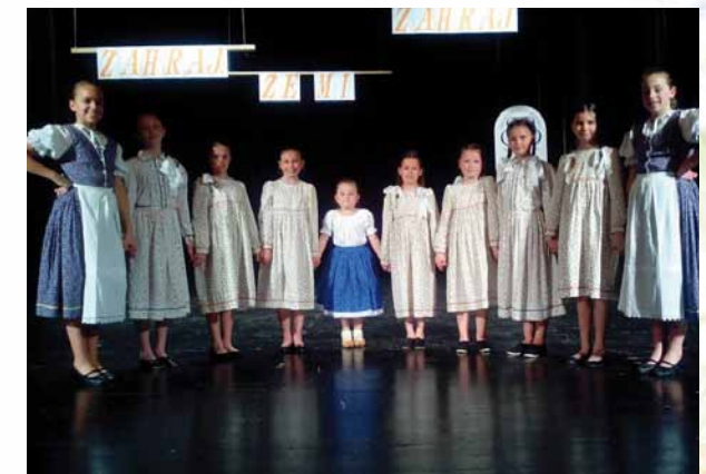
Spevácka skupina „Safolka“