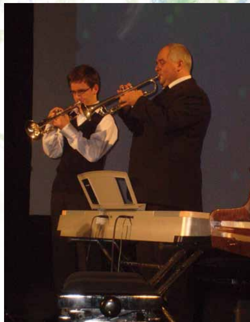
Novoročný koncert 2012